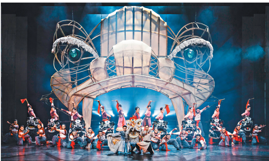
舞剧《醒狮》剧照。